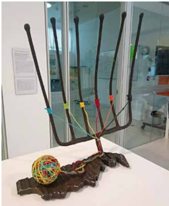
Hierro y lanas de colores / Burdina eta koloretako artileak 50 x 45 x 15 3,5 kg.

Aniztasun hori kantu zirraragarria da hain globalizatua dagoen mundu honetan, arimek beren ingurunea utzi behar izaten baitute biziraupenaren bila, gatazka belikoen, arrazaren, erlijioaren edo sexuaren ondorioz... Koloretako artilezko zamuka, zeinetatik hariak askatzen baitira zoru irregular, gogor eta zimur bat zeharkatzeko, obraren oinarria sinbolizatzen duena, dena hain desiratua den berdintasuna lortzeko. Batzuetan elkarri lotuta, beste batzuetan bakarka, hari horiek aniztasunak ospatzen duen berdintasunerantz egiten dute aurrera. Bidaia hau burdinazko izar baten bidez irudikatzen da, bere sei punta paraleloekin, eta altuera berera igotzen da guztientzat.