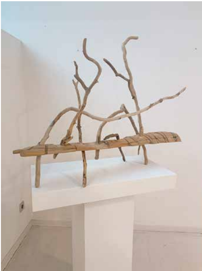
Maderas diversas y maderas traídas por el mar/ Zura desberdinak eta itsasoak ekarritako egurrak 87 x 110 x 70

Obra abstraktua da, hainbat egurrekin egina, hondartzan jasotako 7 adarrekin, ez ditut aldatu, aurkitu nituen bezala daude, eta erdikoa, Nafarroako baso batean bilduko enbor puzka bat. Enborraren gainkaldea eraldatu, zizelkatu eta zulatu egin dut, horrela, adarrek zeharkatu, lurretik altza ahal izateko eta zutik mantendu. Objektu bakar batean jatorri desberdinetako egur mota asko integratzen dierelarik.