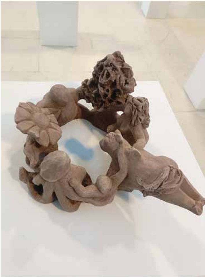
Gres con chamota/ Gresa txamotarekin 40 x 22 2Kg.

Bizitzaren ospakizuna, topaketaren poza, konpasean elkartzea, mugimenduan partekatuz. Denak desberdinak, denak berdinak.