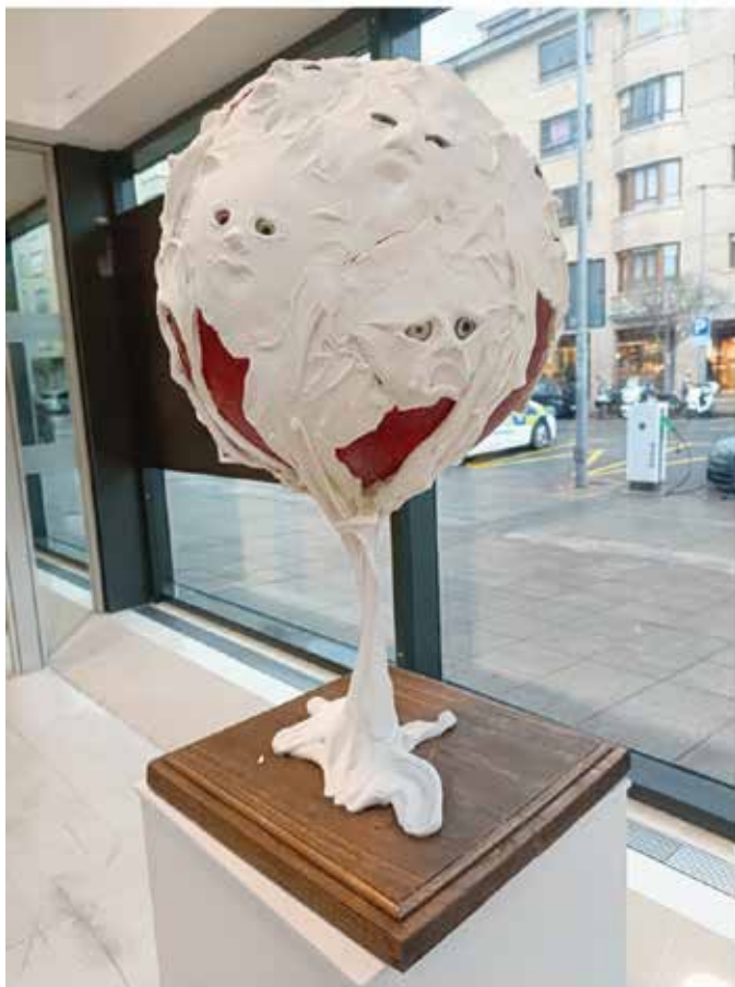
Espuma de arcilla, ojos de resina, y base de poliespan/ Buztin-aparra, erretxina-begiak eta poliespan-oinarria. 60 x 30 x 30

Obrak gizakiaren hauskortasunari eta edertasunari buruzko mezu indartsu bat ekartzen du gogora, planetako bazter guztietako pertsonek borroka eta itzaropenak islatuz. Odolak, oinarrian, sakrifizioa eta partekatzen dugun lotura sakona sinbolizatzen ditu, eta, desberdintasunak alde batera utziz, denok elkarrekin konektatutako osotasun baten parte garelako gogorarazten digu.