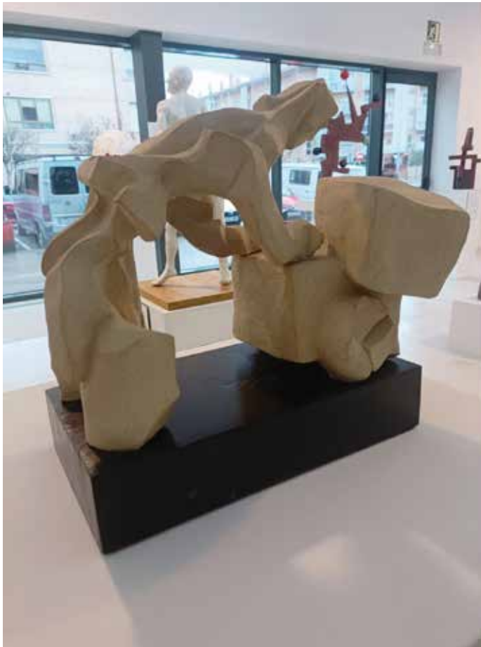
Gres CH con base de madera/ Zurezko oinarria duen CH gresa 33 x 33 x 22

Migrazioak, batzuetan, pobrezia eta bazterkeriak zeharkatzen dituzte. Caballito auzoko kartoigile argentinar hau bizirauteko estrategien adibide bat da, pertsona batzuek bizirik irauteko beste batzuek kalean uzten dutena birziklatuz.