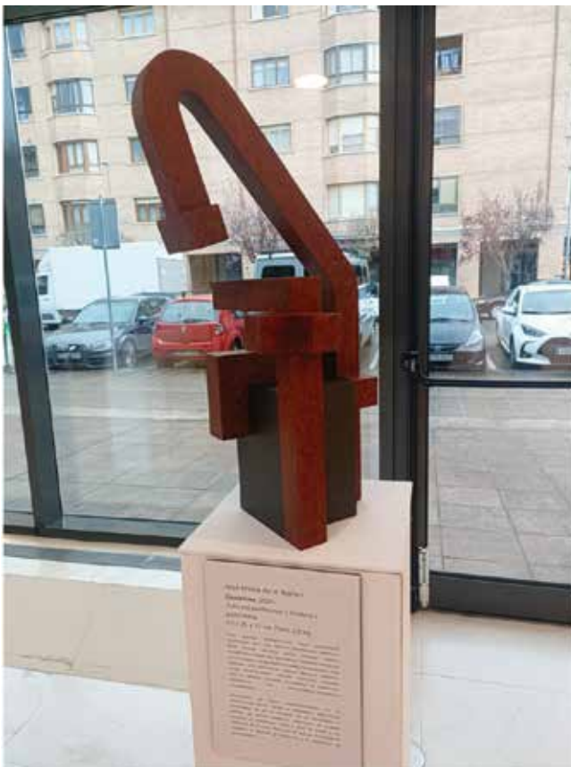
Madera y policromía/ Zura eta polikromia 63 x 35 x 37 2,8 kg.

Gaur egungo arkitekturaren obra garaikideak irudikatzen ditu, non egitura intrinkatuak hedatzen diren (hortik datorkio izena). Horrela, diseinu modernoko eraikin bat agertzen da. Gaudiren arkuak eta haren lanaren irtenguneak bezalako elementuetan ikus daitezke nire eskulturaren, gogora dezagun Gaudiren kurba katenarioaren esanahi espiritual sinboliko sakona. Bakean bizitzeko, funtsezkoa da sinesmen-askatasuna eta pentsamendu-aniztasuna errespetatzea.