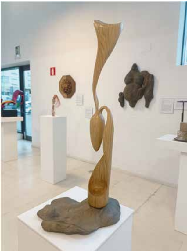
Madera de roble y piedra/ Haritz zura eta harria 67 x 30 x 22

Egurraren zain bihurriek naturaren konplexutasun aberatsa islatzen dute, batasun harmoniatsua osatzeko elementu desberdinak nola elkartzen diren irudikatuz. Kontu handiz landutako xehetasun bakoitzak artistaren trebetasuna eta grina nabarmentzen ditu, bizitzaren esentzia bere aniztasunean harrapatuz. Artelan honek izaki guztien arteko lotura intrintsekoaz hausnartzera gonbidatzen gaitu, desberdinak izan arren, batzen gaituen espiritu komuna partekatzen dugula gogoraraziz.