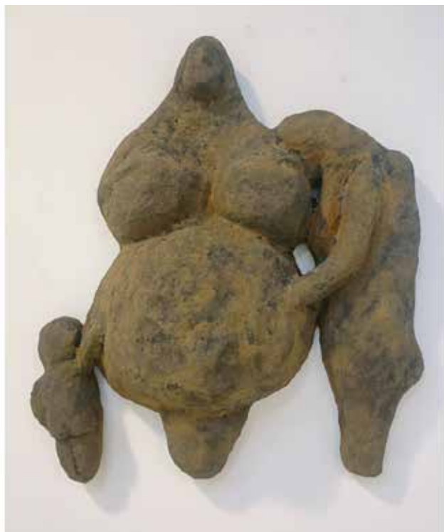
Papel mache/ Mache papera 3 kg

Hainbat etapa, interes, begirada, rol, gorputz... bizi ditugu gure bizitzan zehar. Bakarrak eta askotarikoak bihurtuz aldi berean, gure indibidualtasunaren barruan, hainbat emakumek hitz egiten dugula gure bizitzaren bidean zehar, eta, are gehiago, agian ez litzatekeela bat etorriko bata eta bestea, dibertsitate horren barruan ... Hautzaroak, haurdunaldiak, zahartzaroak, aldaketak eragiten dizkigute, desberdinu, kontrajarri egiten gaituzte, baina, desberdintasun horren barruan esentzia bera izaten jarraitzen dugu; ikaskuntza guztiarekin, bizitako esperientzia guztiarekin, garenok "eginarazten" gaituzten eraldaketa bateratuak.