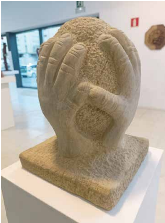
Piedra arenisca / Hareharri 25 x 25 x 30

Nortasunaren bilaketa” irudikatu nahi dut. Kulturak gugan duen boterea, atxikimenduak pertsonengan duen pisua: jatorriak, sustraiek, tradizioak. Jasotakotik abiatuta identitate bat eraikitzea edo, aitzitik, mitoak eraistea gure benetako identitate-esentzia aurkitzeko.