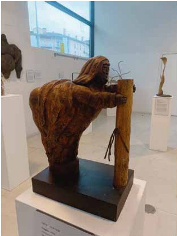
Madera de nogal y boj/ Intxaurrondo eta ezpel-zura 35 x 22 x 50

Flagelatzen den moja batek hipokrisia eta fariseismoa irudikatzen ditu. Itxuren dualtasuna, erakusten denak beti barne errealitatea islatzen ez duen mundu batean. Mundu inperfektu batean garbitasun espiritualaren bilaketan daramatzagun maskaren eta berezko kontraesanen inguruan hausnartzera gonbidatzen gaitu. Intxaurrondo eta ezpela aukeratzeak giza esperientziaren konplexutasuna sinbolizatzen duen ehunduren aberastasuna ematen du, eskultura gure dualtasunaren ispilu bihurtuz.