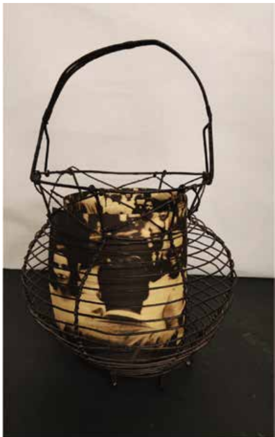
Jaula de huevos e inyección de tinta pigmentada sobre papel Conqueror verjurado/ Arrautza-kaiola eta tinta pigmentatuaren injezioa Conqueror paper berjuratu ganean. 25 x 25 x 35

Ikasi eta, nahigabeei gaina hartuta, bere Emakume erretratua kaiolak umetoki gisa duen sinbolismoaz mintzatzen da, emakumearen ugalketarako edukiontzi gisa. Paperean inprimatuta dauden irudiek, barrutik eta kanpotik, emakumeak beste pertsonekin dituen harremanen joan-etorriaz hitz egiten dute, oro har, bizitzaren erretratu bat da.