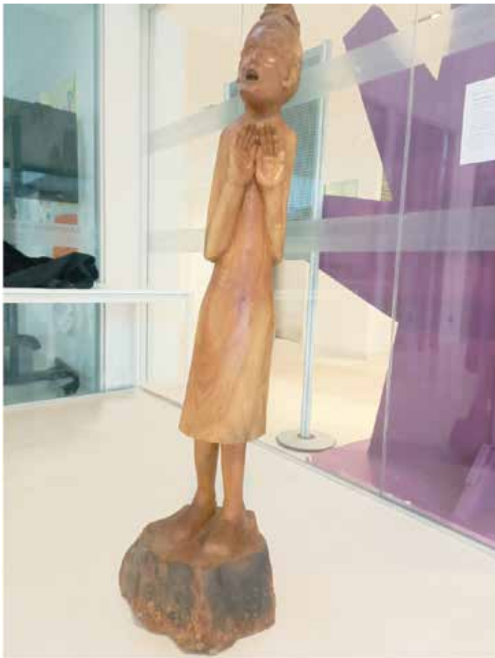
Madera de cerezo/ Gereziondo zura. 38 x 38 x 153

“Abusu” oro egiten duenak duen boterean eta zigorgabetasunean oinarritzen da; azken hori beste inoren AHULTASUN egoeraz baliatzen da. Ezinbestekoa da gizarte bidezkoak sortzea, gizabanako kalteberenak babestuko dituztenak eta, kalteak gertatuz gero, konpontzen lagunduko dutenak.