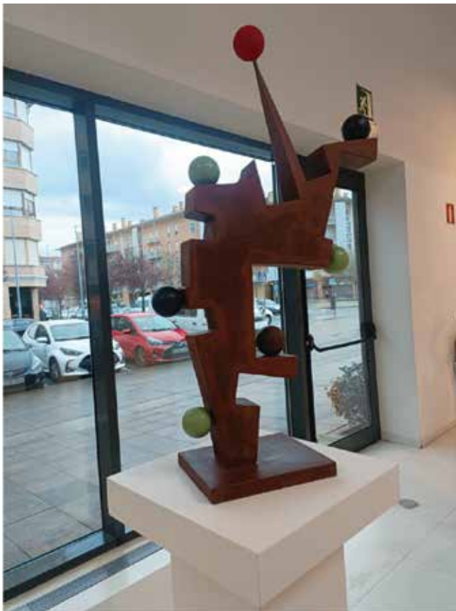
Acero Corten / Altzairua 106 x 58 x 8 30 kg.

Burdinazko eskultura da, elkarri lotutako egitura geometriko batean altxatzen dena, elementuen batasuna eta sendotasuna sinbolizatzen dituena. Puntetan koloretako boleak dir-dir egiten dute. Horietako bakoitzak aniztasunaren alderdi bat adierazten du: kultura ezberdinak, osotasun bat osatzen duten identitate ezberdinak, edertasuna gure ezberdintasunak ospatu eta elkarrekin lan egiten dugunean sortzen dela gogoraraziz.