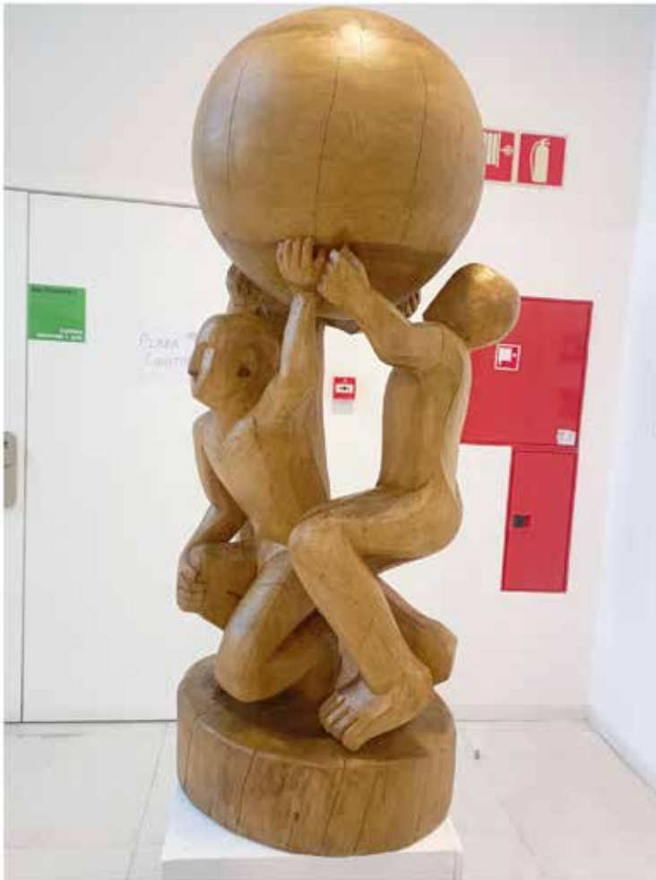
Madera de cedro/ Zedro egurra 111 x 44 x 40

Bakoitzak bere ikuspuntutik bizi eta sufritzen du mundua. Gauden tokiaren arabera, nor garen eta nondik gatozen, perspektibak ez dira berdinak. Denok zapaltzen dugu espazio komun bera, Lurra, bizikidetzarako esparru etikoak ezartzea ezinbestekoa da.