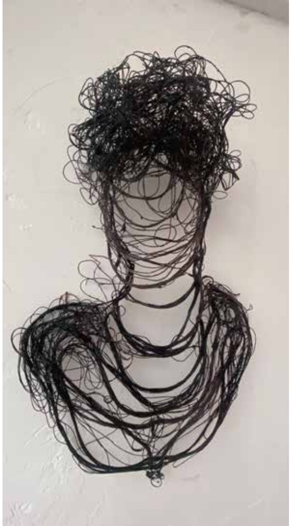
Hilo de fibra de vidrio ignífuga y resina eco/ Suaren aurkako beira-zuntzezko haria eta ekologikoa 65 x 50x15 cm.

"Izakia" obra geometrikoago eta simbolikoago baterantz doan Valentinararen eboluzioa da. "Izaki" bakoitza hiritar modernoa da, eta haren benetako edo irudimenezko esistentzia masa baten parte den eta aurretik estereotipatutako edo asmatutako ideia irudikatzen duen "Izaki" sozializatu eta inpersonala da. Bakoitzak sentsualitatearen, borrokaren, artearen, etniaren... ideia irudikatzen du, eta bilduma honek bizikidetzakulturalaz, beharrezko nahasketaz eta errespetuaz hitz egiten du. "Nerabea" artelanak. "Nerabea" obrak ez du sexu zehatzik, ia aurpegirik ez izateak obrarekin empatia duen pertsona oro irudikatzen duen asmoa dauka. Estereotipo sozialen kritika hutsa da.