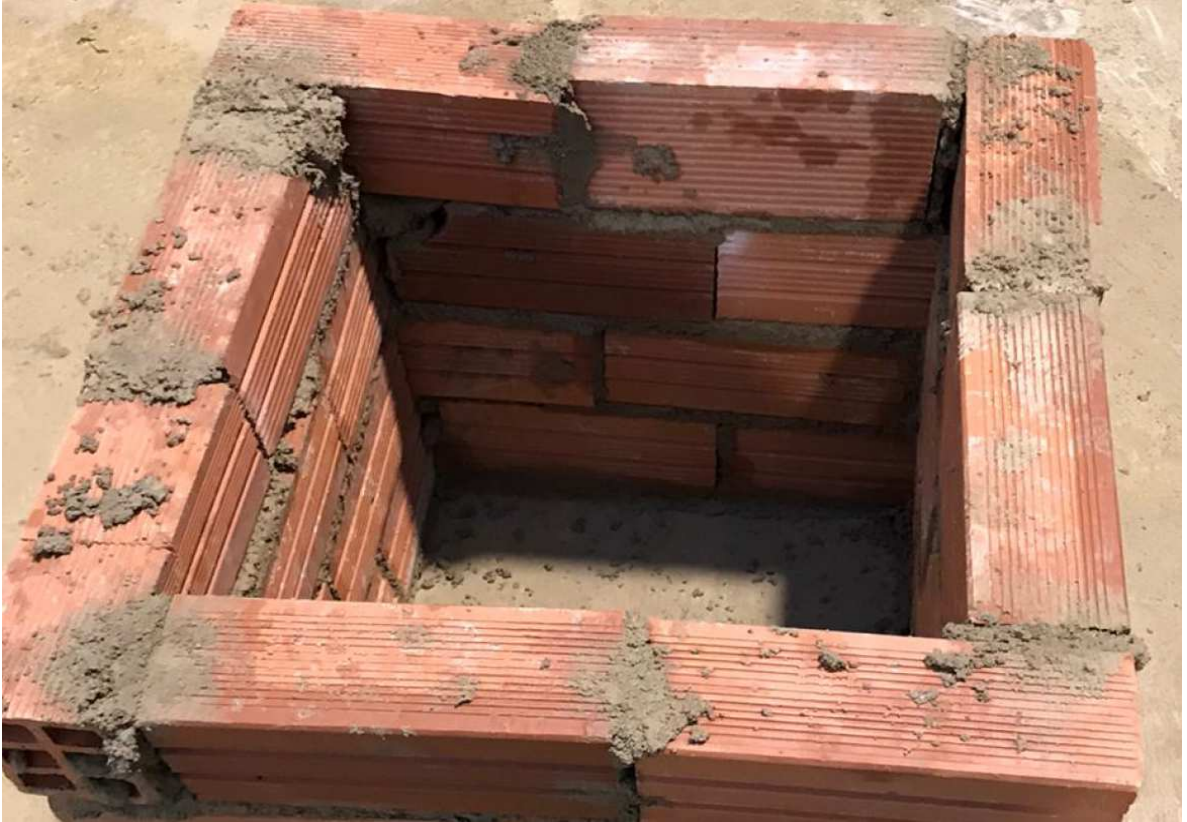
2-2 David Azpilicueta Guembe

No ha lucido, la plomada mal, ha trabajado sucio, no ha acabado en tiempo. De las cinco arquetas, la más justa. No obtiene puntuación adicional por lo que se queda con los 5 puntos iniciales.