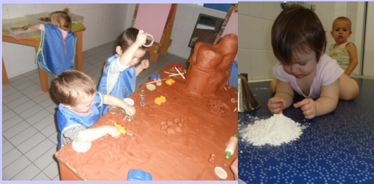
Talleres de investigación / Ikerketa tailerrak