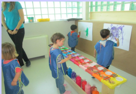
Psicomotricidad relacional Erlazio psikomotrizitatea