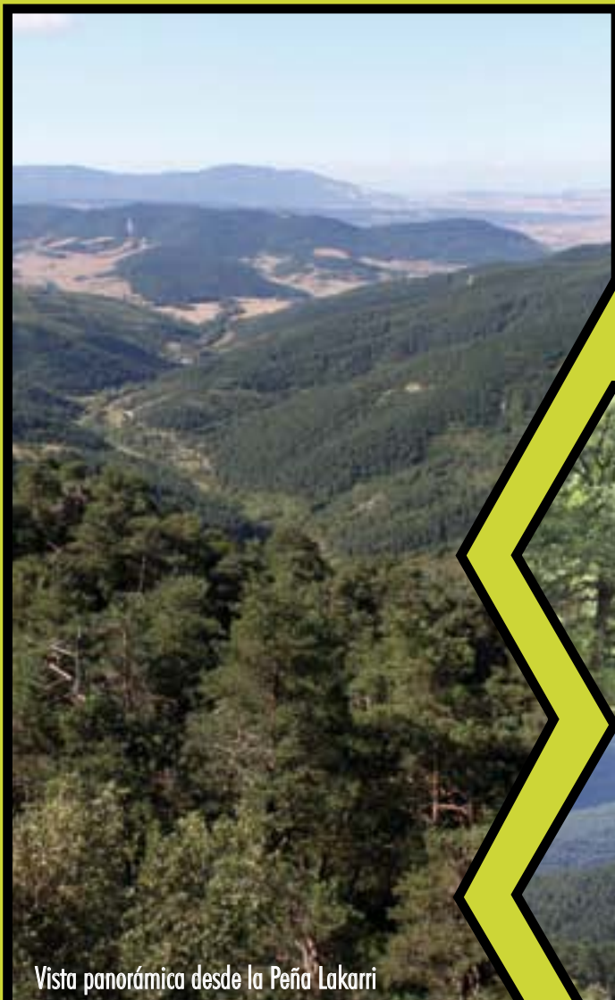
Vista panorámica desde la Peña Lakarri

En el espacio protegido tenemos una interesante muestra de los paisajes, flora y fauna de los terrenos de transición entre la cuenca de Pamplona y el Prepireneo, con buenas muestras de la fauna forestal y fluvial, donde la regata Urbikain se convierte en un hábitat potencial muy adecuado para el establecimiento del visón europeo.