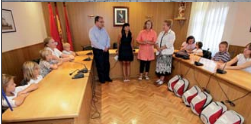
EL AYUNTAMIENTO LES OFRECIÓ EL PASADO 26 DE AGOSTO UNA RECEPCIÓN OFICIAL EN LA QUE LOS NIÑOS Y NIÑAS ACOGIDOS POR FAMILIAS DEL VALLE RECIBIERON MATERIAL DEPORTIVO Y UN APERITIVO DE DESPEDIDA